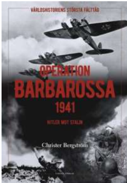
Christer Bergström: Operation Barbarossa 1941: Hitler mot Stalin (2016)