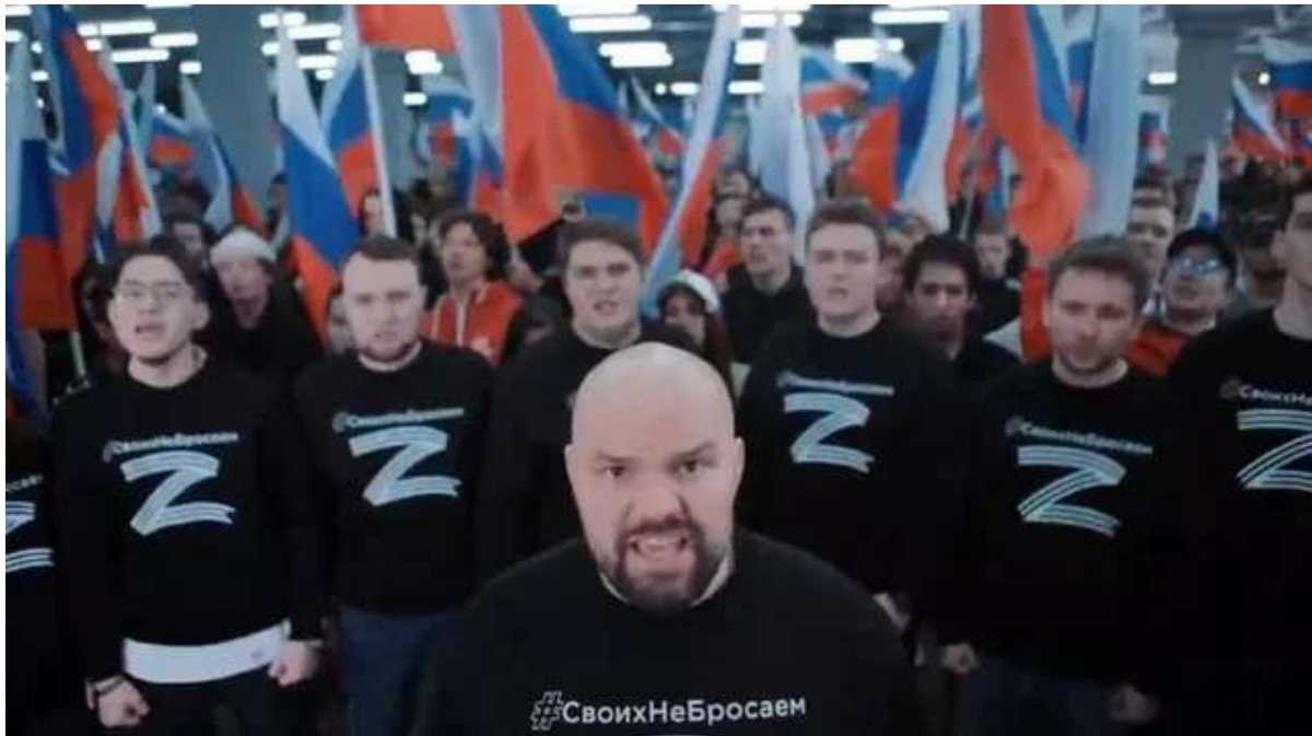
Fascistisk ungdom. Bild från en kampanjvideo till stöd för Rysslands krig mot Ukraina.