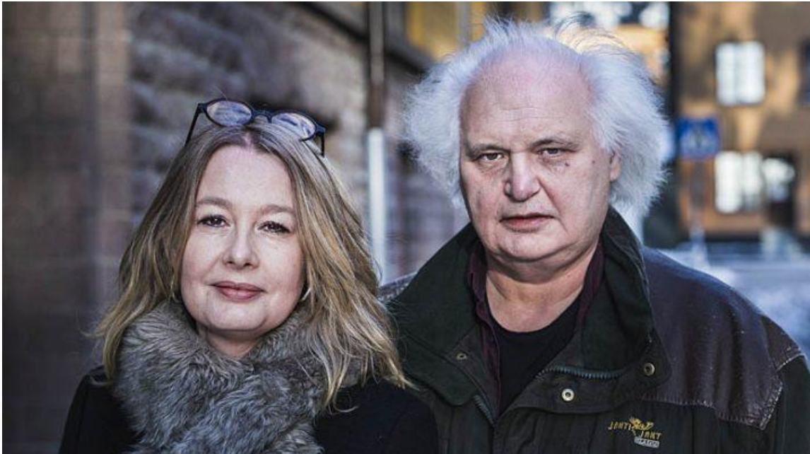
Åsa Linderborg och Göran Greider.