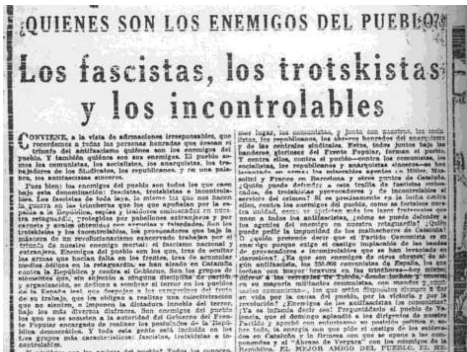
Mundo Obrero (kommunistpartiets dagstidning) den 13 maj. Rubrik: "Vilka är folkets fiender? Fascisterna, trotskisterna och de okontrollerbara"

En kort tid efter majdagarna gick stalinisterna till frontalangrepp mot POUM: POUM-pressen förbjöds, ledande POUM-medlemmar arresterades, inklusive de flesta i partiets centralkommitté, många POUM-anhängare, särskilt utlänningar, mördades av stalinistiska agenter osv. De följande texterna handlar om detta. För en mer övergripande redogörelse för förföljelsen av POUM, se t ex artikeln Mordet på Andreu Nin – hur gick det till? som bl a innehåller ett längre utdrag ur ”standardverket” Spanska inbördeskriget av historikern Hugh Thomas.