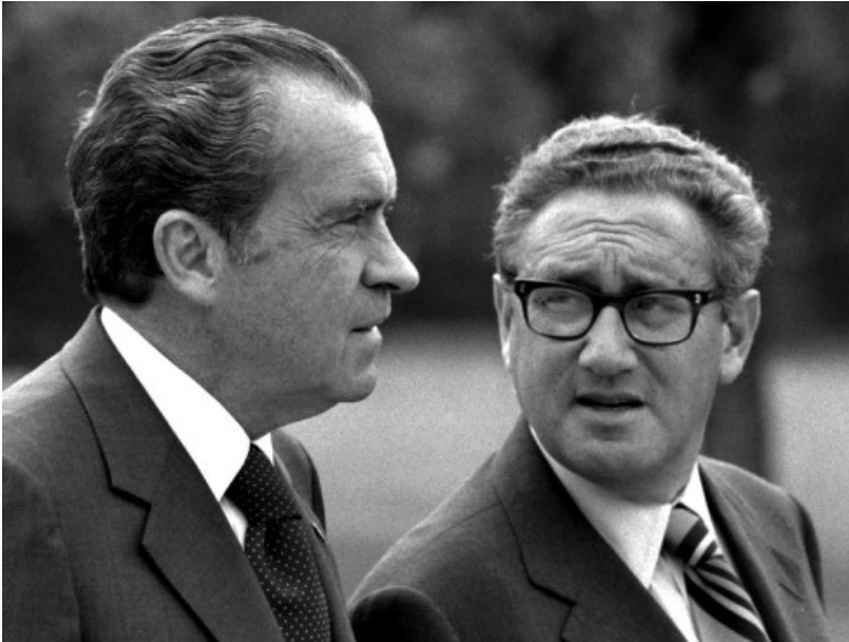
Henry Kissinger med President Richard Nixon, 1970.