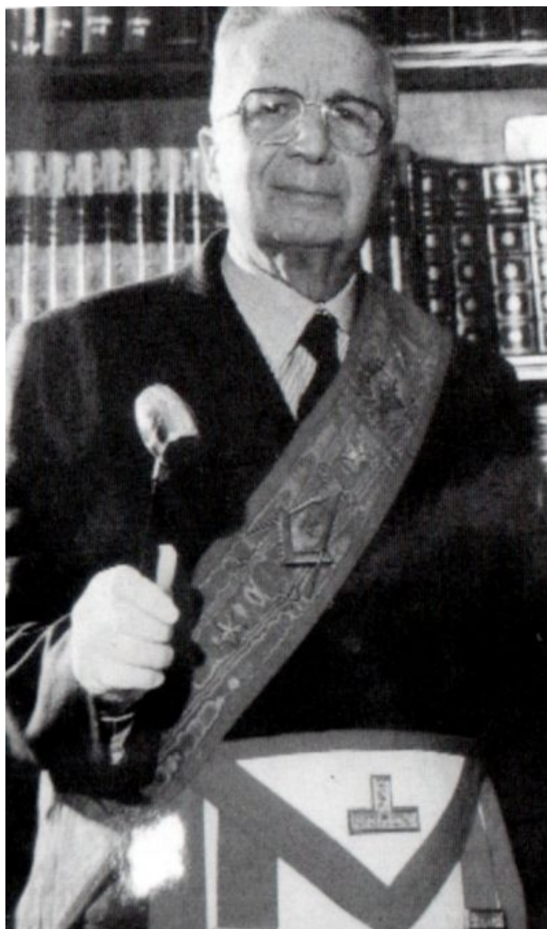
Licio Gelli, medlem i den italienska frimurarlogen Propaganda Due (P-2).