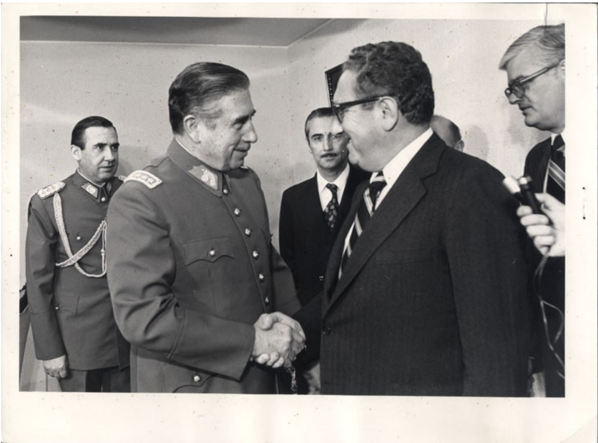
Augusto Pinochet och Henry Kissinger 1976.

För 45 år sedan lanserades, under stort hemlighetsmakeri, officiellt Operation Condor: en global, våldsam förtryckskampanj mot den latinamerikanska vänstern från regionens halvfascistiska militärdiktaturer. USA:s regering inte bara kände till programmet – den hjälpte till att iscensätta det.