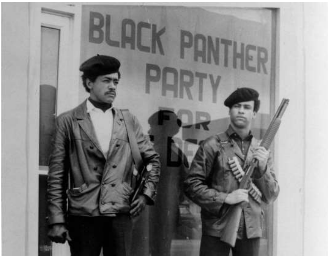
Svarta pantrarnas grundare Bobby Seale och Huey P. Newton.

Huey Newton och Bobby Seale studerade tillsammans på Merritt College i Oakland i Kalifornien. Inspirerade av Malcolm X:s uppmaning att slå tillbaka "med alla nödvändiga medel" grundade de Svarta pantrarna för självförsvar den 15 oktober 1966. Deras val av namn och symbol var en hyllning till LCFO:s arbete i Alabama. De utvidgade konceptet "Black Power" till mer än bara "parlamentarisk politik" och ansåg att "alla nödvändiga medel" innefattade att ta till vapen för att försvara svarta som utsattes för polisbrutalitet. De vägrade acceptera att allt skulle fortsätta som tidigare. Svarta pantrarna skulle inte låta någon hindra dem från att höras.