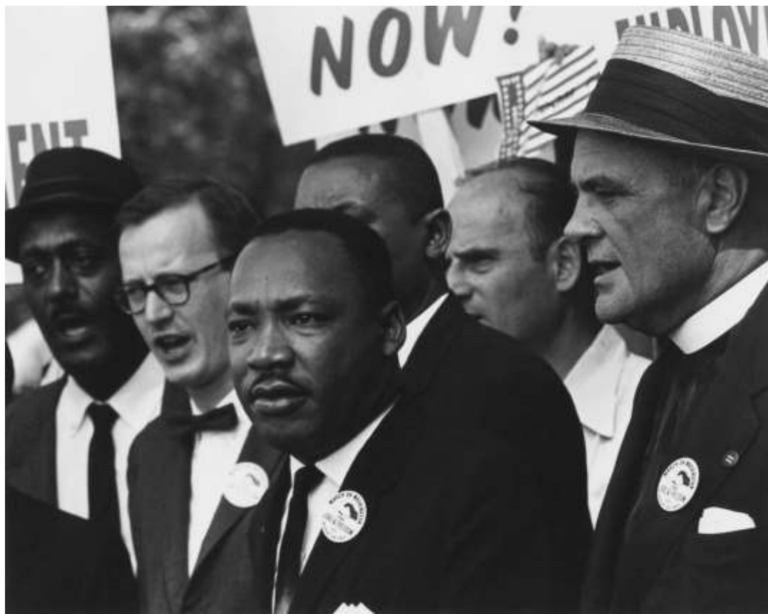
Luther King i "Marschen till Washington för arbete och frihet" 1963.