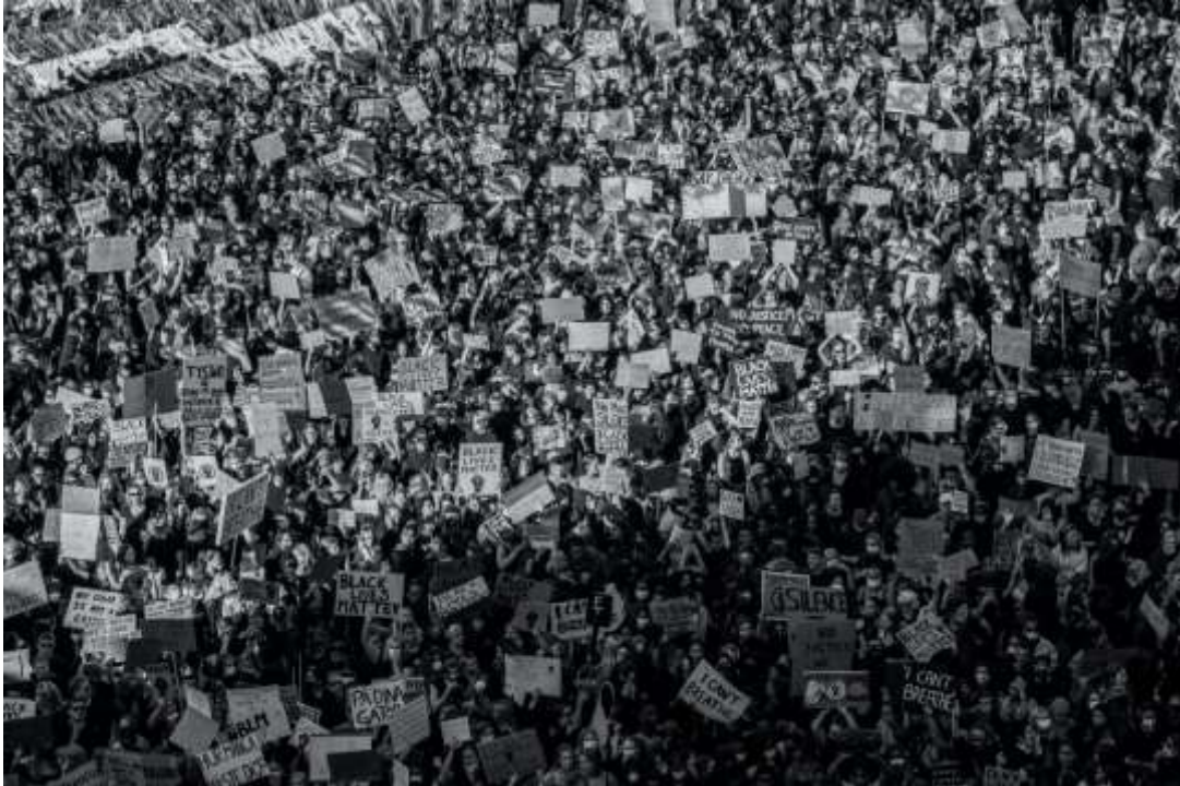
Black Lives Matter demonstration på Sergels torg i Stockholm.

De senaste 160 årens erfarenheter visar oss att arbetarklassen inte kan improvisera fram ett revolutionärt parti i sista stund. Det är en lång och svår process att hitta, pröva och utveckla kadrer, program, metoder och traditioner. Den motsägelse vi står inför är att det är just nu vi måste bygga, i en tid då behovet av en sådan organisation inte känns lika brådskande och intensivt som det kommer att kännas i framtiden. För när brådskan väl blir uppenbar har vi kanske inte tid nog att skaffa ihop allting. Det är därför marxister måste göra de nödvändiga uppoffringarna nu, om vi ska kunna vara redo inför framtiden.