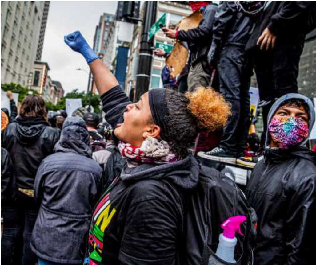
Polisens terror och kapitalismens plågor har mött en urstark massrörelse i Seattle.