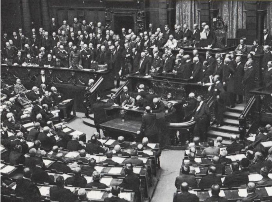
Tysklands riksdag röstade för kriget

Undantaget var den ryska socialdemokraternas två partier – de revolutionära bolsjevikerna och de inomkapitalistiska mensjevikerna – och den serbiska socialdemokratin. I andra länder var det enskilda, oppositionella strömningar inom socialdemokratin och socialdemokratiska ungdoms- och kvinnoorganisationer som tog upp kampen mot det imperialistiska kriget och för arbetarsolidaritet.