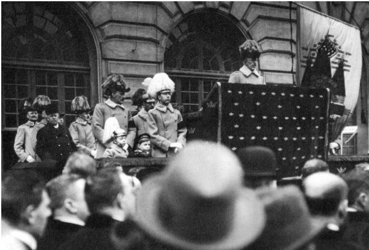
Kung Gustaf V talar under borggårdskuppen i februari 1914

Kungens kupp 1914, som har gått till historien som borggårdskuppen , ledde till att en ny icke-parlamentariskt vald regering tog över. Den nya regeringen befolkades av storkapitalister och storgodsägare. Wallenbergdynastins stamfader K. A. Wallenberg blev utrikesminister, textilindustrins storägare Axel Wennersten finansminister och godsägaren friherre Johan Beck-Friis jordbruksminister. I spetsen för denna skara kapitalister och adelsmän stod den nya statsministern Hammarskjöld, som bland annat varit en av kungens rådgivare. I folkmun blev Hammarskjöld snabbt ”Hungerskjöld”.