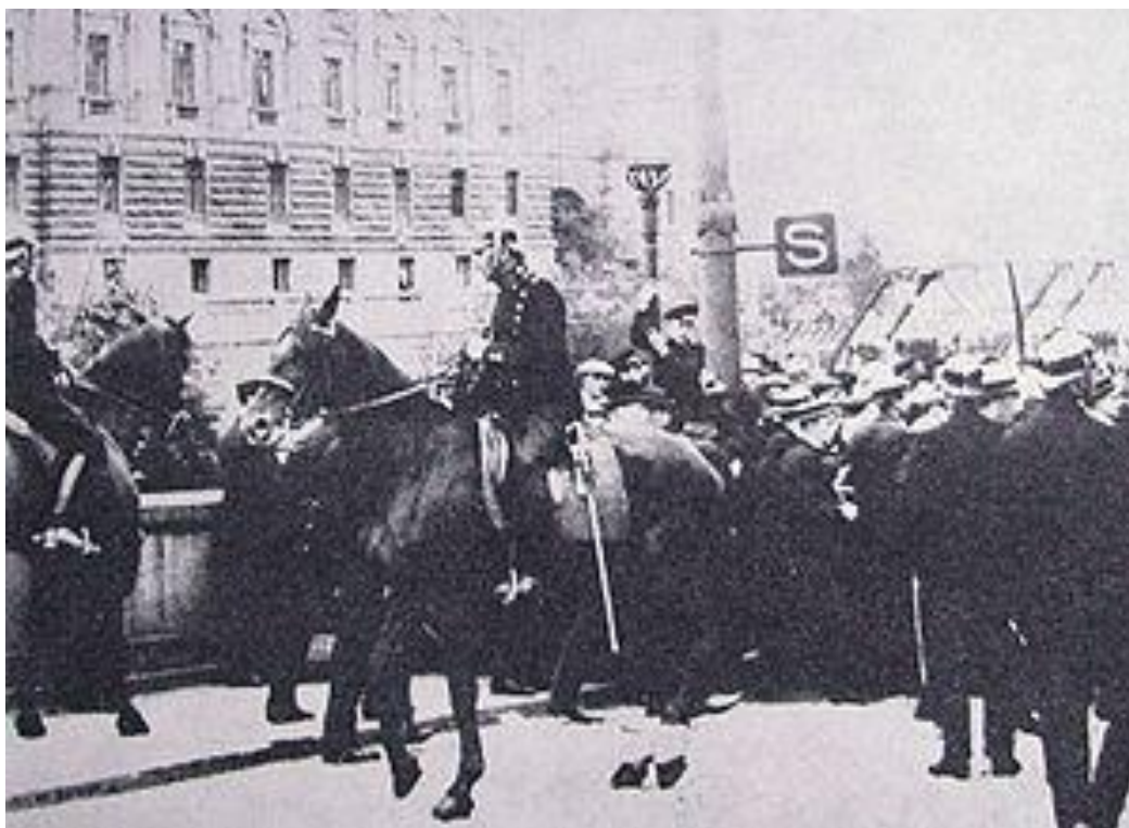
Hungerkravaller vid Gustaf Adolfs torg i Stockholm 1917

Mot borgfredsanshängarna stod partivänstern som hade sitt främsta fäste i den socialdemokratiska ungdomsrörelsen och dess tidning Stormklockan . Vänstern hade sina starkaste sympatier bland de vanliga partimedlemmarna, men dess opposition hämmades av att högern behärskade så gott som samtliga ledande instanser i SAP och LO. Det var för övrigt betecknande att det var först efter en kampanj från vänsterns sida som de tre ledande krigsaktivisterna uteslöts.