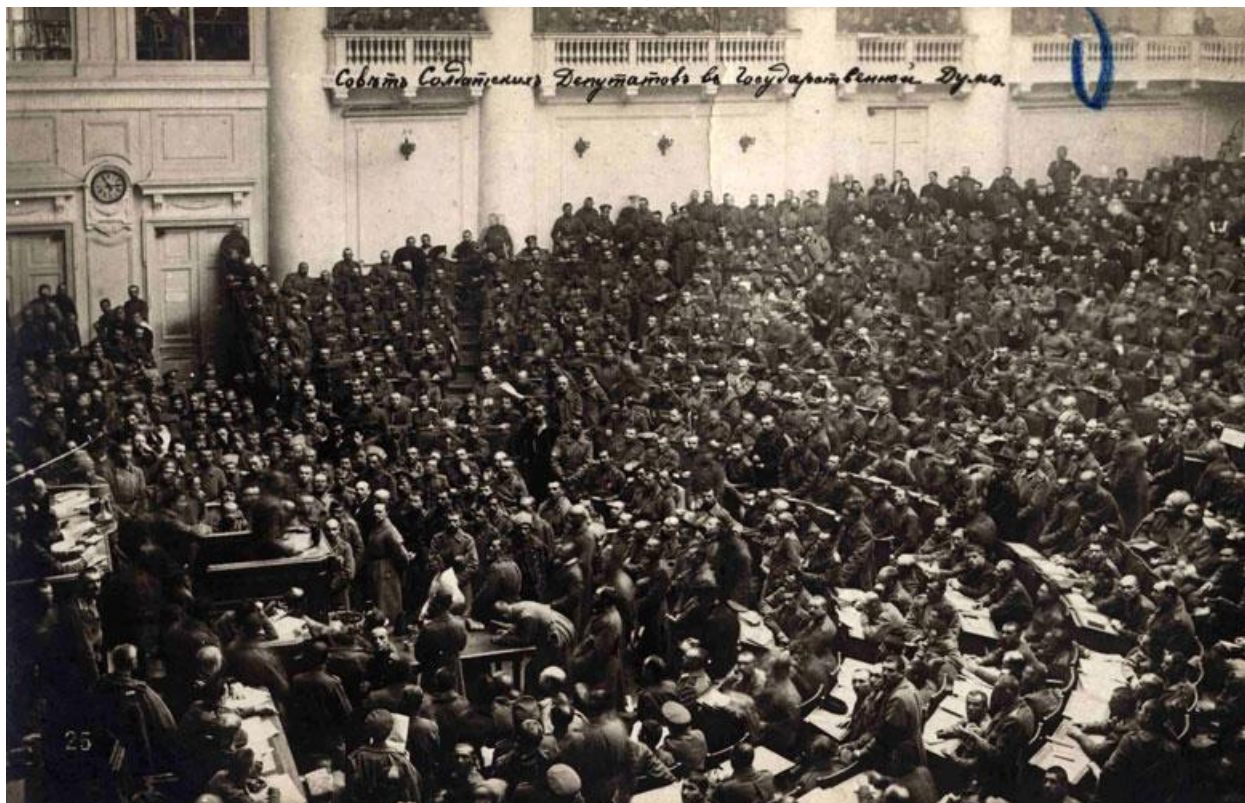
Petrogradsovjeten sammanträder 1917

Det var hög tid att förbereda det revolutionära maktövertagandet – upproret. Det var Trotskij som, genom den revolutionära militärkommittén som Petrogradsovjeten hade bildat till revolutionens försvar, blev upprorets huvudorganisatör. Masstödet till sovjeterna och bolsjevikerna å ena sidan och å den andra att den sittande regeringen och landets härskande klass var helt isolerade utan möjlighet att mobilisera stöd gjorde att oktoberrevolutionen skördade få offer.