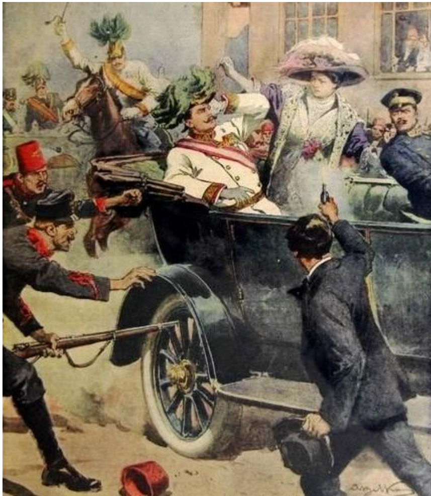
Gavrilo Princip skjuter ärkehertig Franz Ferdinand. Illustration av Achille Beltrame i La Domenica del Corriere den 12 juli 1914.

Efter år av krigsförberedelser följde en allt snabbare nedräkning mot krig med början sommaren 1914. Om inte dödsskotten i Sarajevo hade inträffat skulle en annan händelse blivit en ursäkt för att ”släppa lös krafter som redan satts i rullning”, som det heter i en nyutkommen bok, Catastrophe: Europe goes to war 1914 , av den brittiske journalisten Max Hastings. Mordet på Österrike-Ungerns ärkehertig och tronföljare Franz Ferdinand och hans hustru den 28 juni 1914 utfördes av en bosnisk serb, Gavrilo Princip, med stöd av en grupp som blivit känd som Svarta handen med målet att skapa ett stor-Serbien.