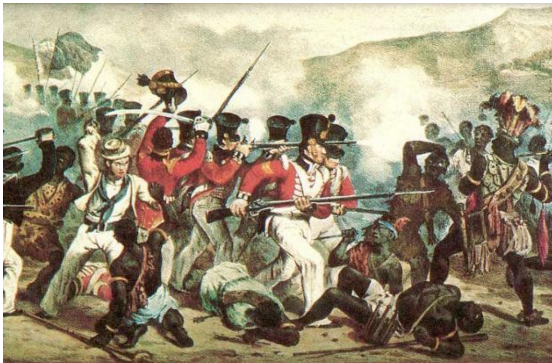
Brittiska kolonialstyrkor slår ner ett uppror i Ghana 1824.

För på måndag hundra år sedan, 28 juli 1914, förklarade det kejsarliga Österrike-Ungern krig mot Serbien. Då tändes den slutgiltiga gnistan i en lång händelsekedja som blev till en förödande världsbrand. Första Världskriget utvecklades till en folkslakt där nästan 10 miljoner soldater dödades och 30 miljoner skadades. Här skriver Martin Hedlund Fink, dansk historiker och marxist, om kolonialismens och imperialismens framväxt inför det första imperialistiska omfördelningskriget 1914. Artikeln är tidigare publicerad i Dagbladet Arbejderen .