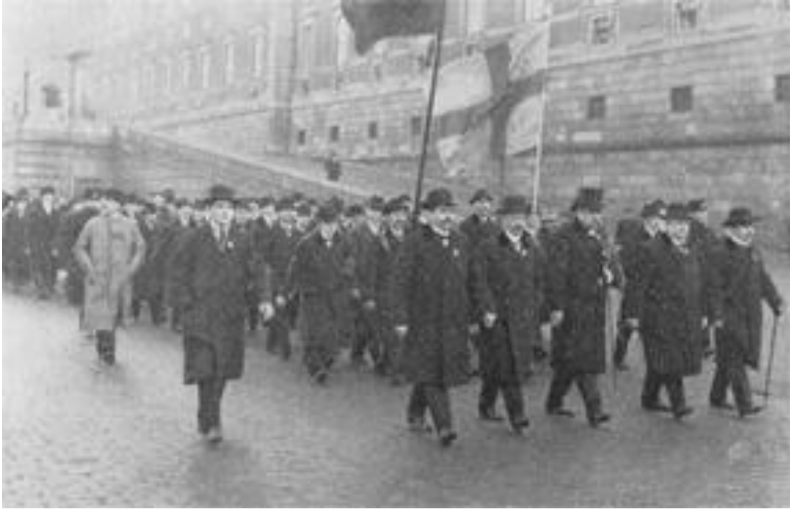
Arbetartåget 8 februari 1914

Arbetartågets väldiga uppslutning inspirerade till en enorm kamplust inom arbetarrörelsen. Ungdomsförbundets flygblad och pamfletter spreds i flera hundratusentals exemplar, och förbundet organiserade enligt dess ledargestalt Zeth "Zäta" Höglund 400 antimilitaristiska möten enbart under påskhelgen.