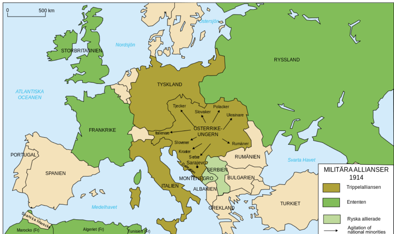
Militärallianser före krigsutbrottet 1914. Trippealliansen sprack när Italien inte gick med i kriget