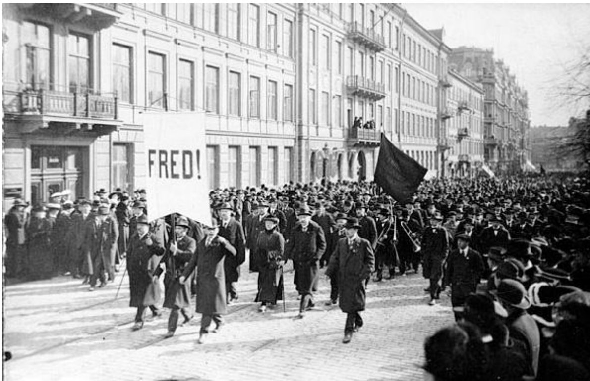
Första maj i Stockholm 1917

Kampen under våren och sommaren 1917 var revolutionens första fas som skulle följas av ny högre fas 1918.