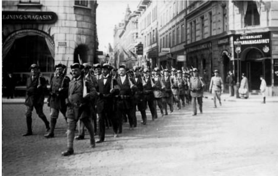
Soldater – svenska värnpliktiga mobiliserades vid krigsutbrottet. Bilden från Stockholm i augusti 1914.

Men trots den utpräglad tyskvänliga hållningen, inte minst från kungahusets sida, var neutraliteten en alltför lönsam historia för att de styrande kretsarna skulle vilja överge den och dessutom riskera en inrikespolitisk kris.